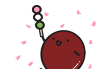
志村図書館マスコットキャラクター あずきちゃん

☆開館時間 午前9:00~午後8:00 ★休館日 定期休館日 毎月第3月曜日 館内整理日 毎月末日 (土・日曜日、祝日と重なる時は 直後の平日)